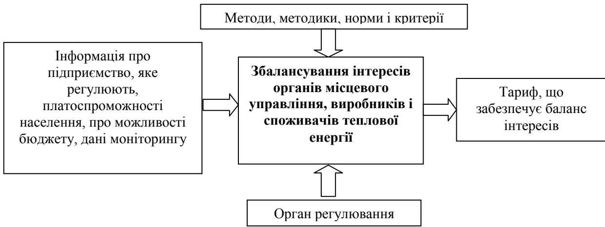
Рис. 1. Модель системи тарифного регулювання [6].

З огляду на викладене, можна зробити висновок, що ключова роль у системі тарифного регулювання теплопостачальних підприємств належить органам місцевого самоврядування, оскільки, по-перше, вони виступають як владна структура, що встановлює «правила гри» і визначає умови функціонування суб'єктів системи; по-друге, як суб'єкт регулювання інтересів виробників і споживачів послуг комунальних підприємств міста; по-третє, як представник власника муніципального майна. Однак дана система буде ефективна лише за наявності партнерських відносин владних структур, теплопостачальних підприємств і населення. Графічно дану модель взаємин можна представити у вигляді схеми, наведеної на рис. 2.