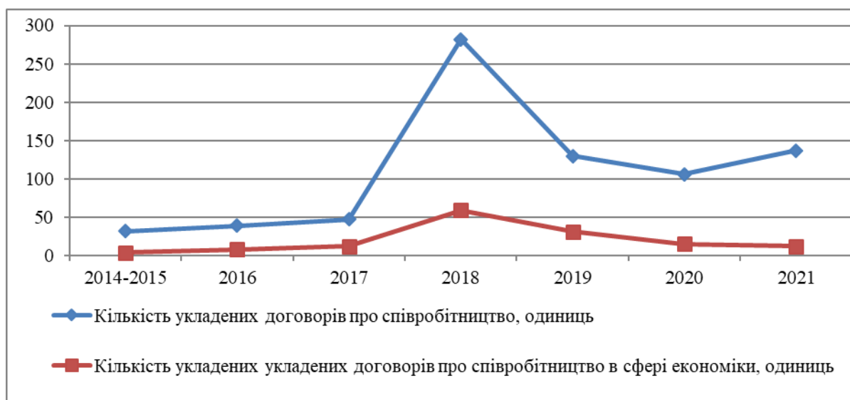
Рис. 1. Динаміка кількості укладених договорів співробітництва громад в Україні.

Виклад основного матеріалу дослідження. Запровадження в Україні інструментарію співробітництва територіальних громад дало змогу комплексно та згуртовано вирішувати значну кількість соціальних питань, підвищити якість надання адміністративних послуг, спільно подужати ті проекти, які самотужки громадам реалізувати складно. Однак, окрім вирішення нагальних адміністративно-соціальних питань, інструментарій співробітництва територіальних громад здатний забезпечити вирішення завдань економічного розвитку, формуючи інституціональний базис для міжтериторіального розподілу праці. Розвиток економічного співробітництва необхідний для забезпечення комплексного зростання в територіально-господарських системах завдяки розширенню можливостей щодо генерації збільшеної доданої вартості. Однак, згідно офіційних даних порталу децентралізації, за останні роки активність застосування інструментарію співробітництва громад суттєво знизилась (рис. 1).