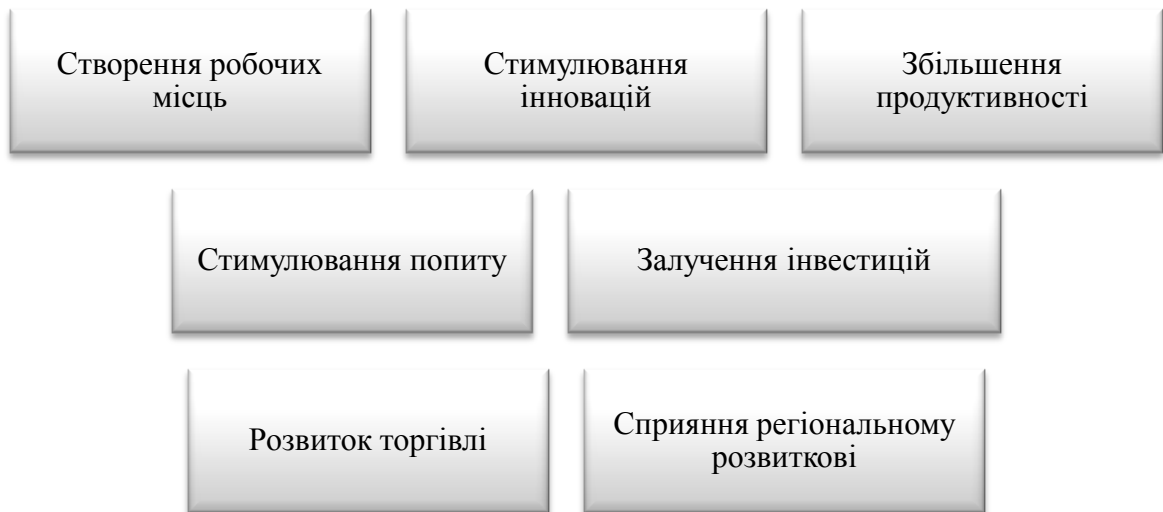
Рис. 1. Механізми підприємництва як ключового фактора стійкого розвитку територіальної громади

Сприяння регіональному розвитку. Підприємці можуть бути ключовими гравцями у розвитку регіональних економік, створюючи нові можливості для місцевого населення.