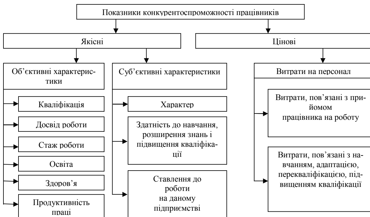
Рис. 4. Показники конкурентоспроможності працівників підприємства

Конкурентоспроможність є інтегрованим показником тих якостей і особливостей персоналу, за рахунок яких саме конкретний працівник є кращим за інших на визначеній посаді з точки зору організації, і за рахунок яких організація надає йому перевагу [1, с. 4]. Важливою передумовою досягнення конкурентоспроможності персоналу є оцінка не лише якісних параметрів, але й кількісних – витрат, пов'язаних із залученням, розвитком та використанням людського капіталу (рис. 4).