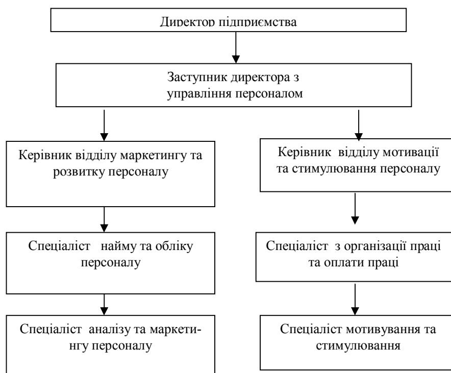
Рис. 1. Схема організаційної структури управління персоналом на підприємстві

Підрозділи на підприємстві слід створювати на базі вже традиційних: відділу персоналу, відділу організації праці та заробітної плати та ін. Створення на підприємстві нових підрозділів, основним завданням яких є розробка та реалізація інноваційних підходів управління персоналом, узгодження з інноваційними підходами підприємства, дозволить розширити коло функцій відділу персоналу. Від, власне, питань роботи з персоналом перейти до розробки систем мотивування та стимулювання трудової діяльності, управління фаховим просуванням, запобігання конфліктів, вивчення ринку праці. На великих підприємства функціональною ланкою у відділі персоналу, на нашу думку, має стати підрозділ аналізу й маркетингу персоналу.