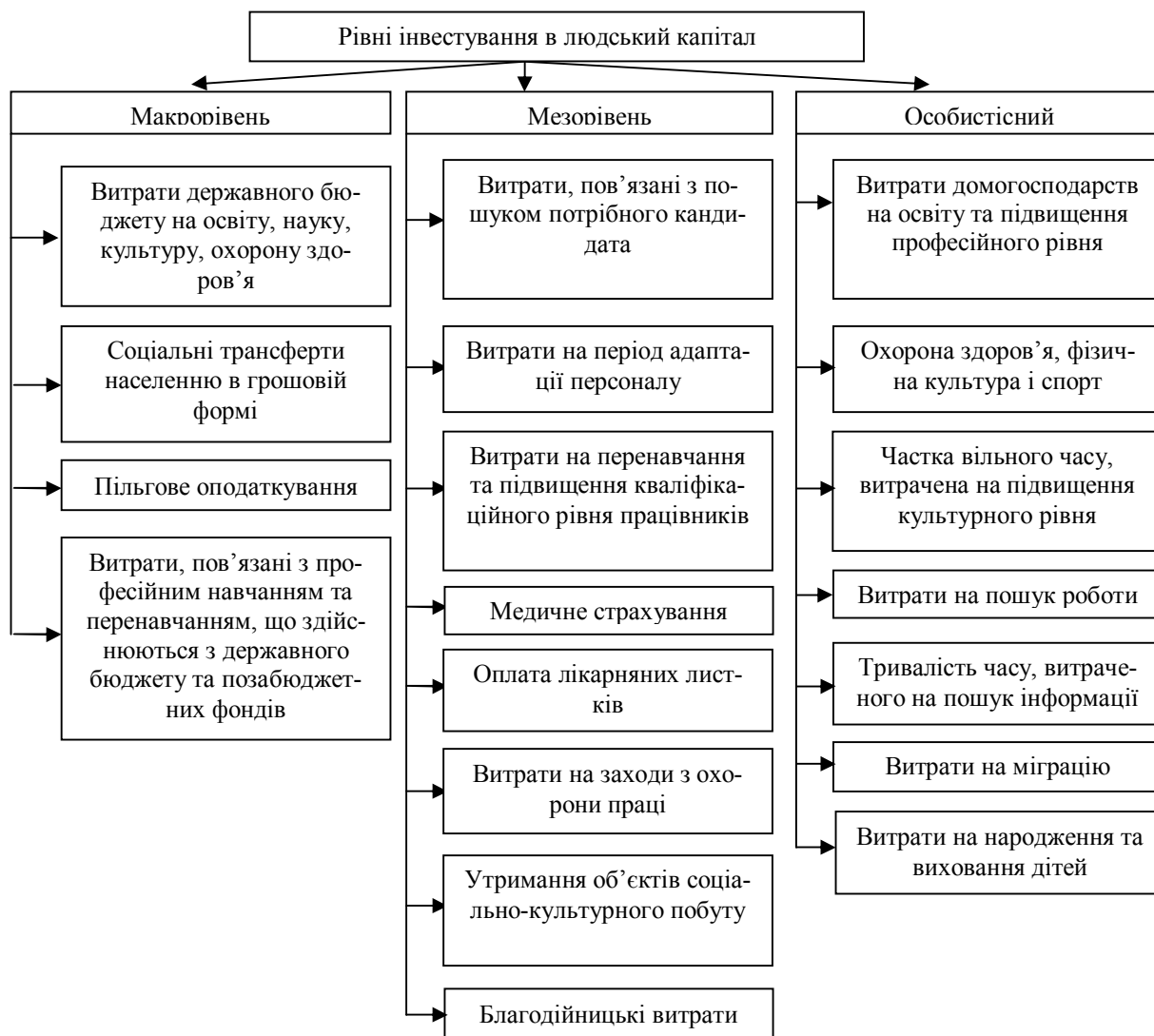
Рис. 5. Рівні інвестування в людський капітал

В. Я. Брич стверджує, що професійний розвиток – це набуття працівником нових компетенцій, знань, умінь і навичок, які він використовує чи буде використовувати у своїй професійній діяльності. [4, с. 176].