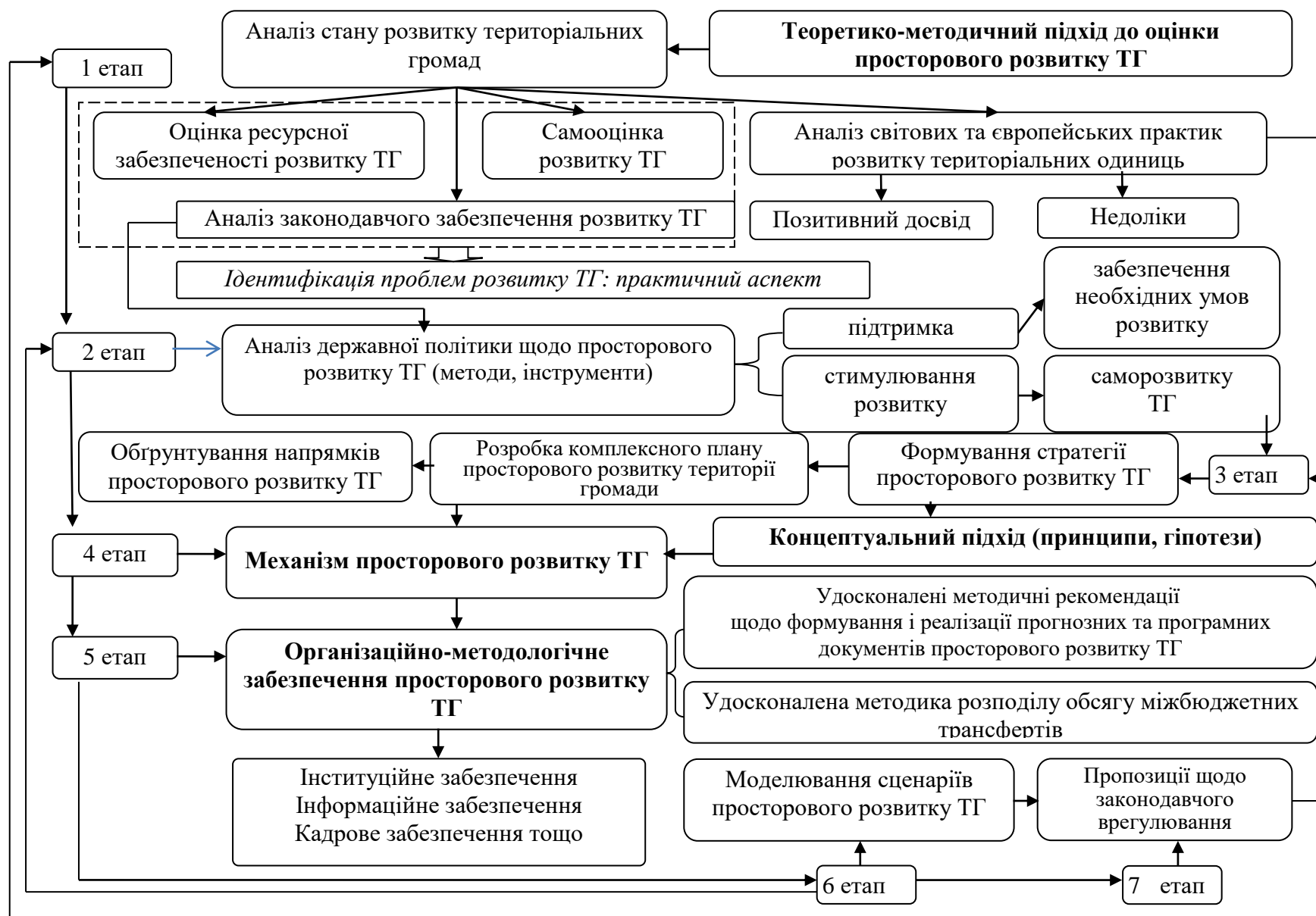
Рис. 3. Операційна модель просторового розвитку територіальних громад