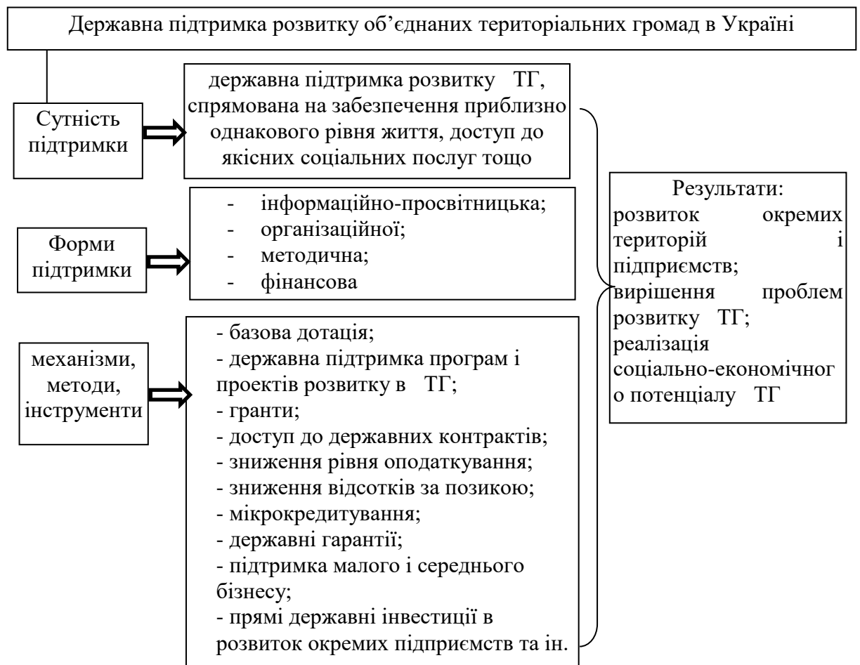
Рис. 4. Складові державної підтримки добровільного територіальних громад та їхнього розвитку

Положення 6. Просторовий розвиток територіальної громади не обмежується її межами та відкриває можливості співпраці для досягнення синергетичного ефекту.