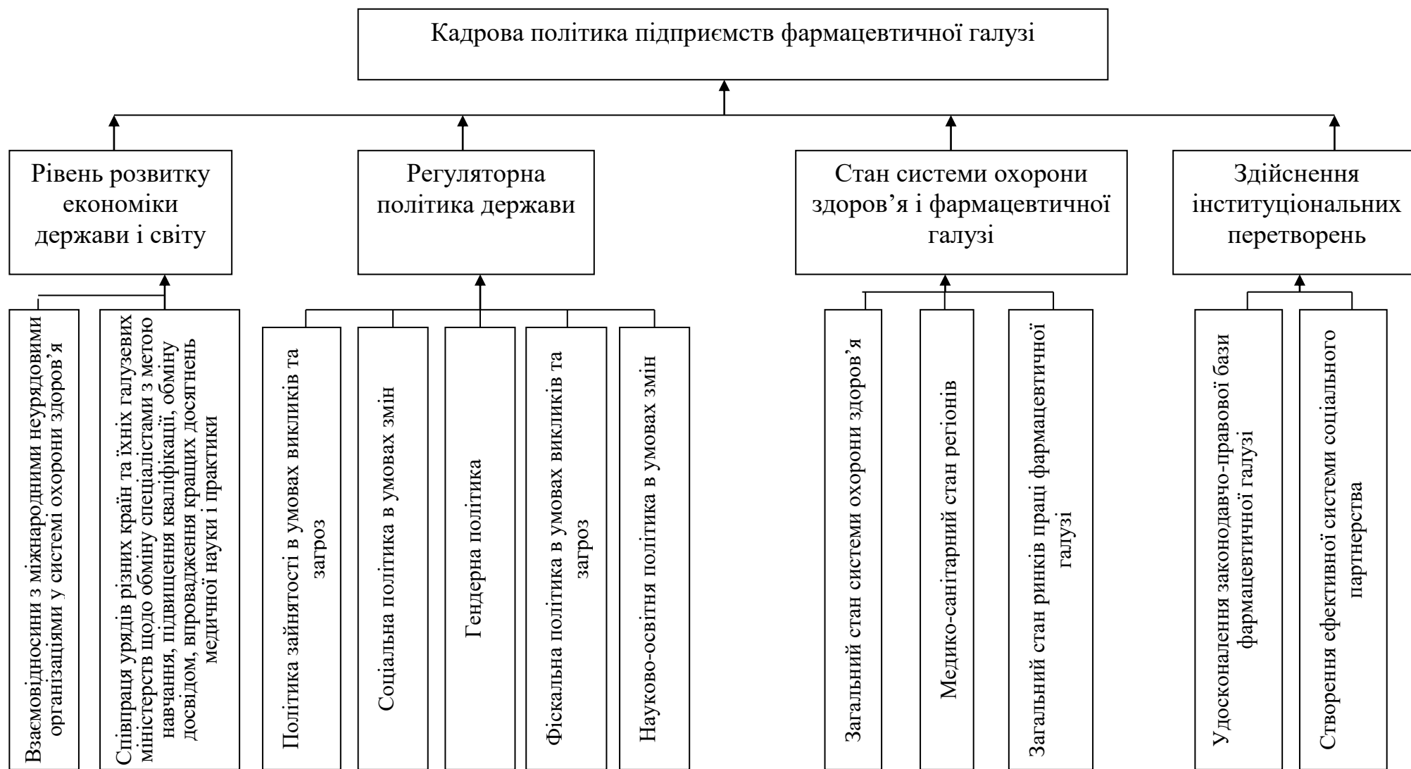
Рис. 4. Модель впливу зовнішніх чинників на формування кадрової політики підприємств фармацевтичної галузі

Примітка: сформовано автором на основі [3]