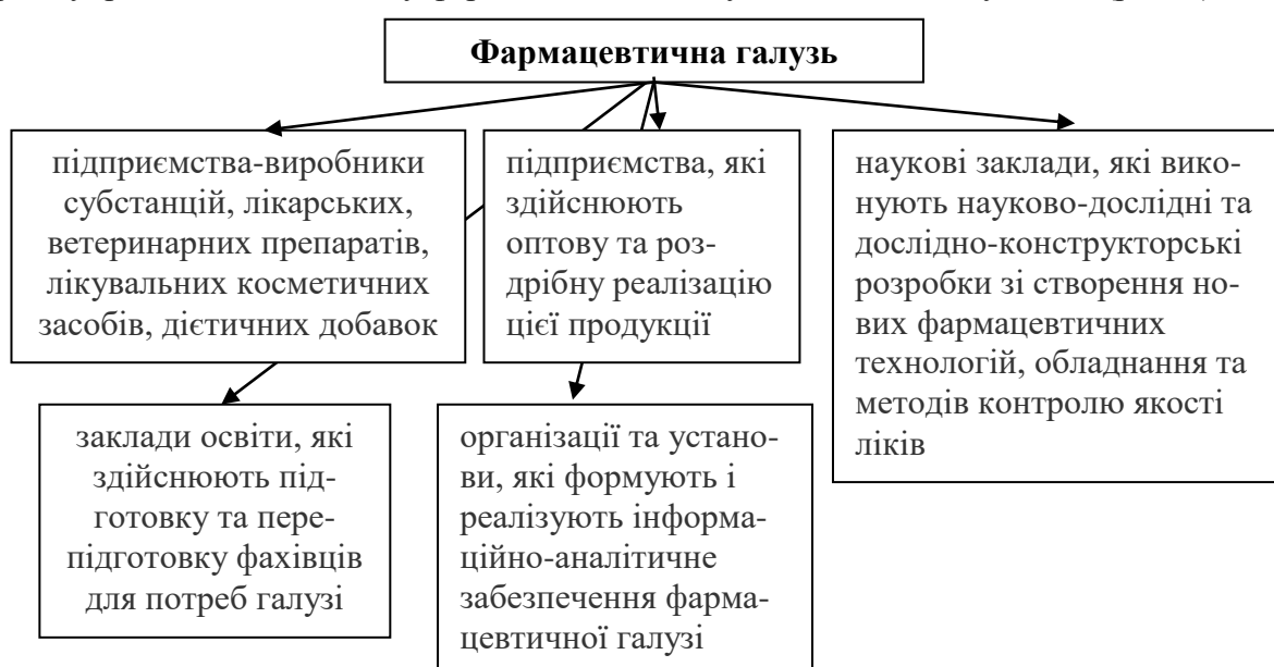
Рис. 1. Склад фармацевтичної галузі України

На думку Ф. Жебровської «фармацевтична галузь об'єднує підприємства, які характеризуються відносною однорідністю продукції, яку вони виробляють та реалізують споживачам, а також тотожністю технічної бази і технологічних процесів, сировини, яка використовується, загальних підходів до організації та управління процесами створення, виробництва, контролю якості та реалізації продукції, а також професійної підготовки кадрів, і має єдиний орган управління». До складу фармацевтичної галузі входять такі суб'єкти (рис. 1):