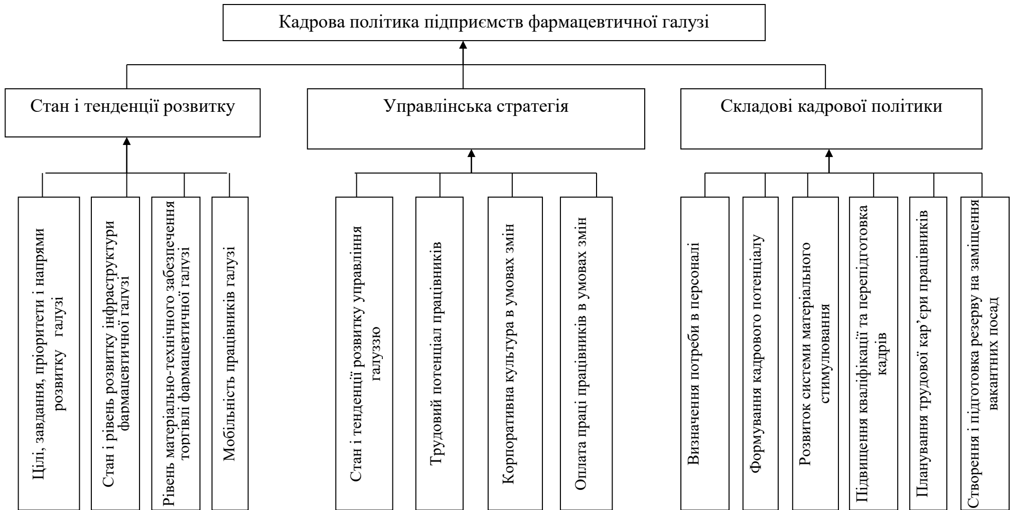
Рис. 5. Модель впливу внутрішніх чинників на формування кадрової політики підприємств фармацевтичної галузі

Примітка: сформовано автором на основі [3]