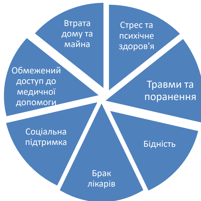
Рис. 1. Вплив війни на стан здоров'я літніх людей.

Після отримання травм літні люди можуть стикатися з обмеженнями в рухах або інвалідністю, що обмежує їх здатність до самообслуговування та незалежного життя. Вони можуть потребувати постійної медичної допомоги, реабілітації та фізіотерапії для покращення фізичного стану.